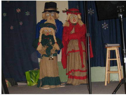
Les magnifiques pièces maîtresses de la décoration de la scène.