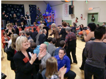
Le jeu de la chaise musicale humaine a semé la joie dans toute l'assistance.