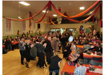
Ça bouge et ça rit dans la salle.