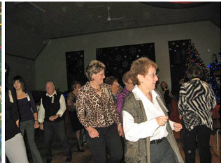
Les danseurs en ligne s'en donnent à coeur joie.