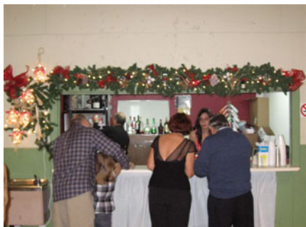
Le coin ravitaillement était parfaitement décoré.