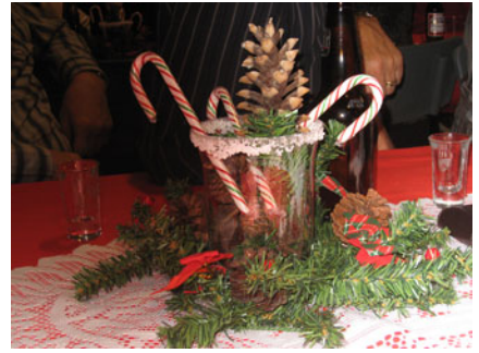
Les spectaculaires centres de tables.