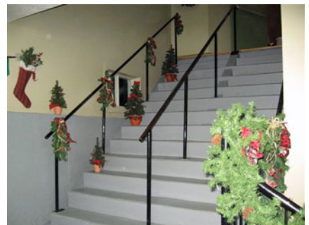
Même l'entrée n'avait rien à envier aux autres décorations.