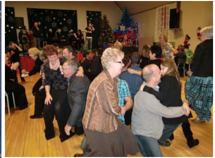
L'activité, la chaise musicale humaine, a non seulement amusé la salle mais aussi dégelé l'atmosphère.