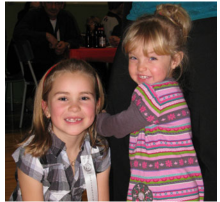
La joie est au rendez-vous.