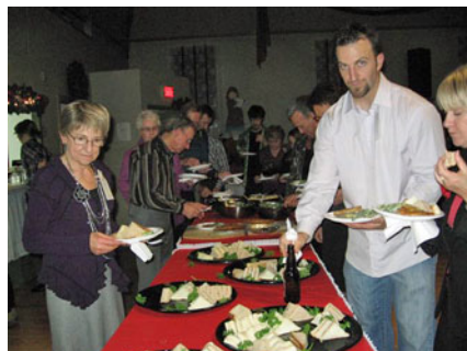
Le temps du réveillon, surtout quand le buffet est bien garni, est très populaire.