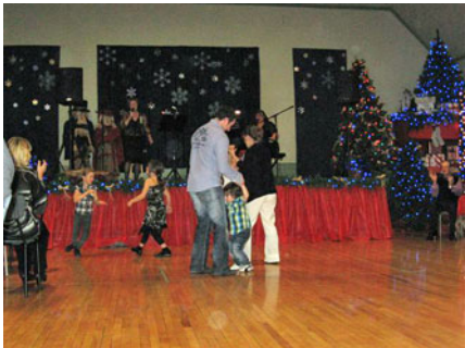
Petits et grands en ont bien profité et ont dansé sur leur musique préférée.