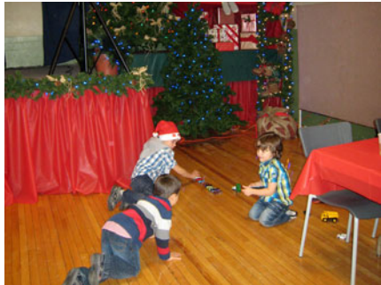
Des petits enfants qui profitent de l'occasion pour s'amuser.