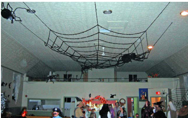
L'immense toile d'araignée au plafond de la salle