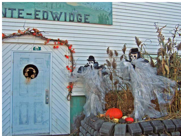
La décoration extérieur du Centre communautaire de Sainte-Edwidge