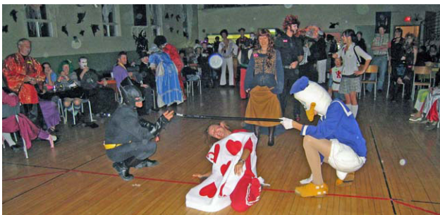
Les danseurs de limbo à l'oeuvre