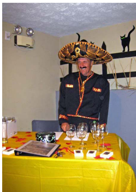
Fernand à la vente de souvenirs