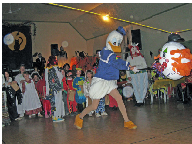
Dernier recours, on fait appel à quelques adultes dont le canard de Walt Disney, sans plus de succès. La Piñata doit être ouverte à la main.