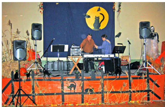
L'intérieur de la salle