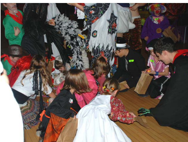
Enfin des sucreries pour tous les enfants présents. Quel délice!