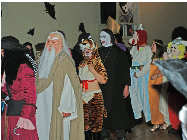
Une partie du défilé des costumes