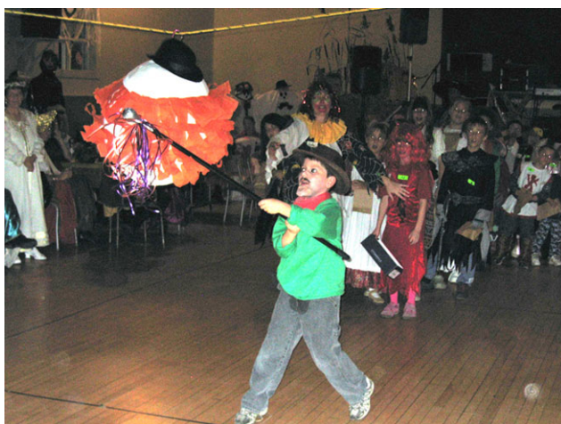
Deuxième tentative, sans plus de succès pour le plus jeune de la famille Dalton.