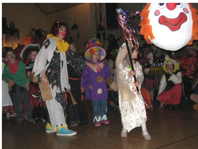
Première tentative sans succès pour cette petite princesse.